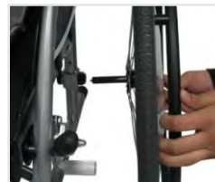
Ruedas traseras Extracción rápida